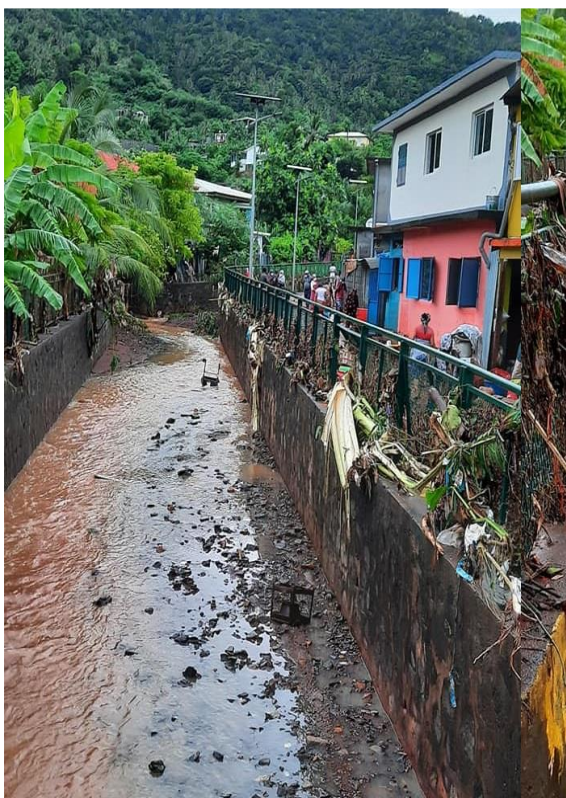
Illustration 2 : Laisses de crues à Acoua sur aux inondations de 2021