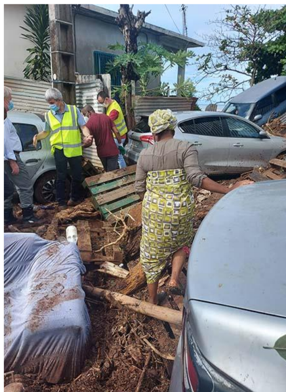
Illustration 3 : Dégâts dans les rues suite aux inondations dans le sud de Mayotte en 2022

Trois cours d'eau (la Gouloué, la Kawénilajoli, la Majimbini et la Kirissoni) et toute la bande littorale ont les enjeux exposés les plus forts et ont été cartographiés au regard du risque inondation et submersion marine. En 2018, le cours d'eau de la Majimbini sur la commune de Mamoudzou avait également été rajouté à cette liste des cours d'eau exposés).